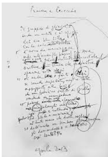
Autografo di Primavera a Ravecchia (aprile 2013) poi divenuta L'uomo da marciapiede

Da : Giorgio Orelli e il "lavoro" sulla parola : atti del convegno internazionale di studi, Bellinzona 13-15 novembre 2014 / a cura di Massimo Danzi e Liliana Orlando. - Novara : Interlinea, 2015, p. 6, versione online http://archive-ouverte.unige.ch/unige:84153 (Free Access), consultato il 28.04.2021